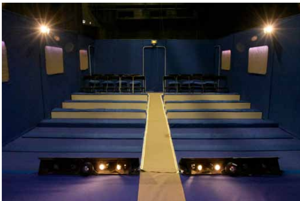
Décor , vue de la scène, gradinnage public.