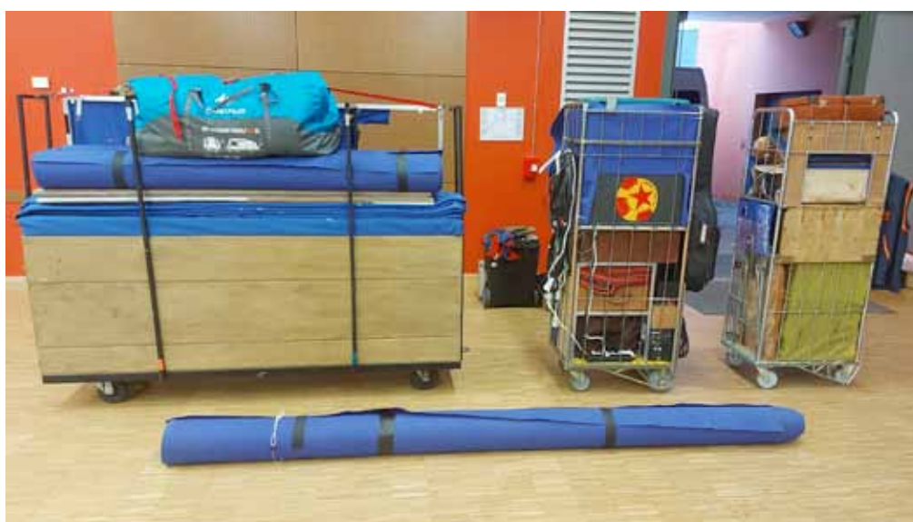
Chariots de chargement du matériel: 2 charriots de 70cm x 48cm x 175cm de haut 1 grand charriot de 243cm de long x 65cm de large x 170cm de haut Déchargement et chargement via une rampe et treuil, fournis par la compagnie.