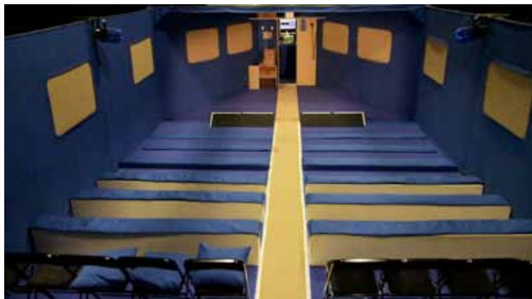
Décor , Vue intérieure, Gradinnage public.