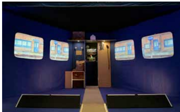
Scène et la cabine conducteur ( régie en arrière plan)