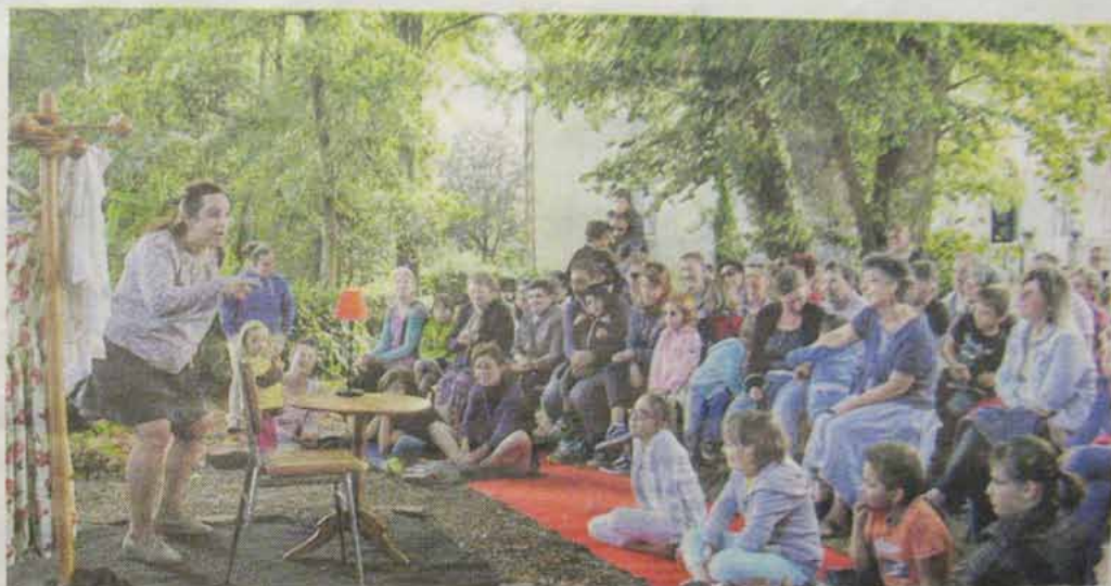
Trois cents spectateurs pour le dernier rendez-vous des P'tits dimanches dans leur ancienne version.

Un rendez-vous qui clôture une année prolifique, puisque c'est 65 représentations qui ont été données sur toute la France dont le festival désarti-